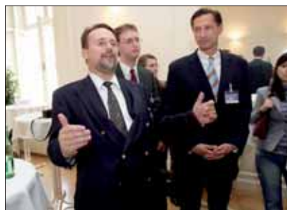
Mitarbeiter der Rechtssektion.