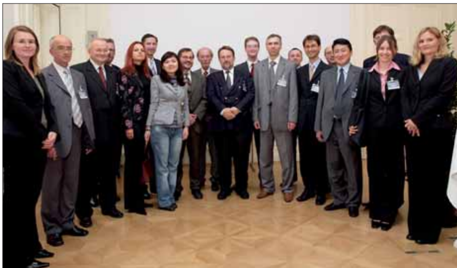
Wahlexperten aus OSZE-Teilnehmerstaaten sowie Angehörige der Bundeswahlbehörde und des BMI.