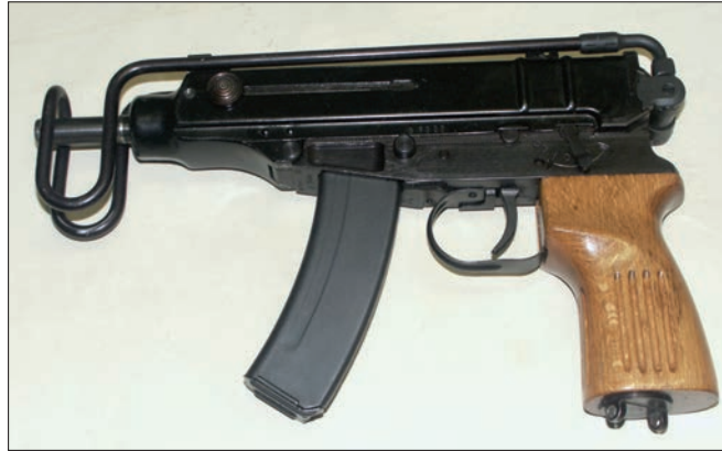
Deaktivierung von Schusswaffen und Kriegsmaterial: Umbau und Kennzeichnung.

Deaktiviert werden können zivile und bestimmte militärische Schusswaffen wie Maschinenpistolen und vollautomatische Gewehre sowie diesem Kriegsmaterial zugehörige Läufe und Verschlüsse (§ 42b Abs. 1 WaffG). Der Vorgang der Deaktivierung besteht in einem Umbau der Schusswaffe und im Anbringen einer Kennzeichnung, der „Deaktivierungskennzeichnung“. Der Umbau hat so zu erfolgen, dass die wesentlichen Bestandteile einer Schusswaffe wie Lauf, Verschluss oder Trommel, irreversibel unbrauchbar sind und nicht mehr entfernt oder ausgetauscht oder in einer Weise umgebaut werden können, die eine Wiederverwendbarkeit als Waffe ermöglichen. Die von einem ermächtigten Waffengewerbetreibenden anzubringende Deaktivierungskennzeichnung soll zweifelsfrei erkennen lassen, dass es sich um einen deaktivierten Gegenstand und nicht mehr um eine Waffe im Sinne des Waffengesetzes handelt.