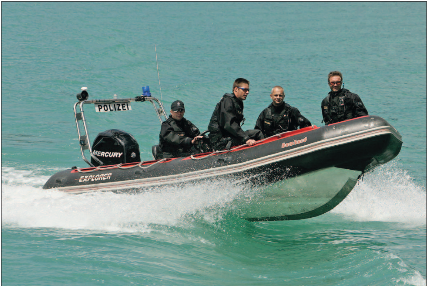
2014 absolvierten die DSE-Taucher 23 Einsätze; bis Mitte März 2015 wurden sie 15-mal angefordert, davon in zwei Cold-Case-Fällen.

stoff in verschiedenen Zusammensetzungen erreicht. Das Gas-Gemisch wird vor jedem Tauchgang auf den Einsatz abgestimmt.