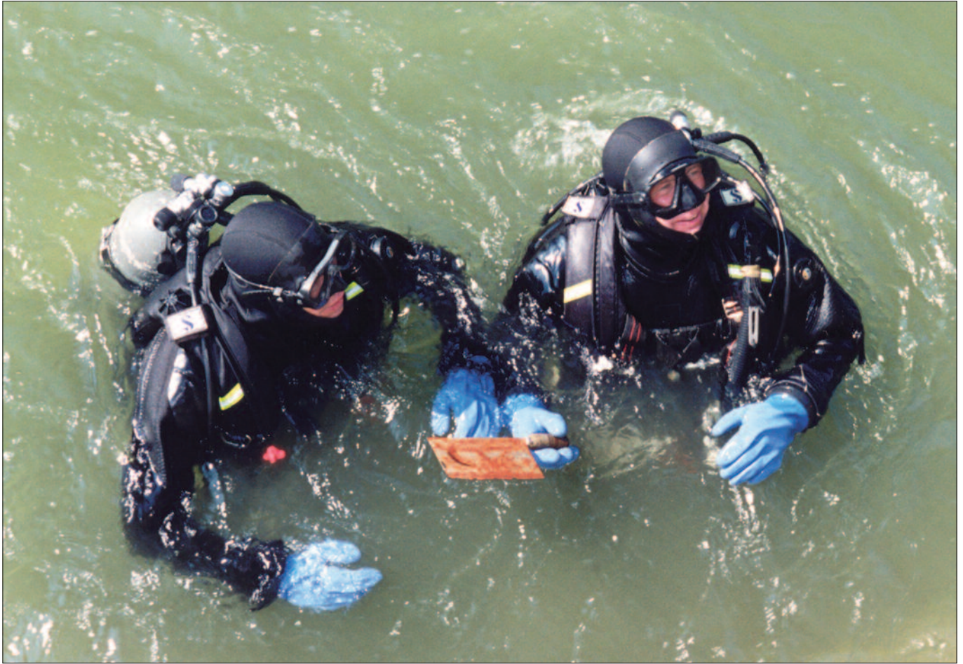
Polizeiliche Taucheinsätze: Beim Einsatzkommando Cobra/Direktion für Spezialeinheiten gibt es 16 Einsatztaucher.