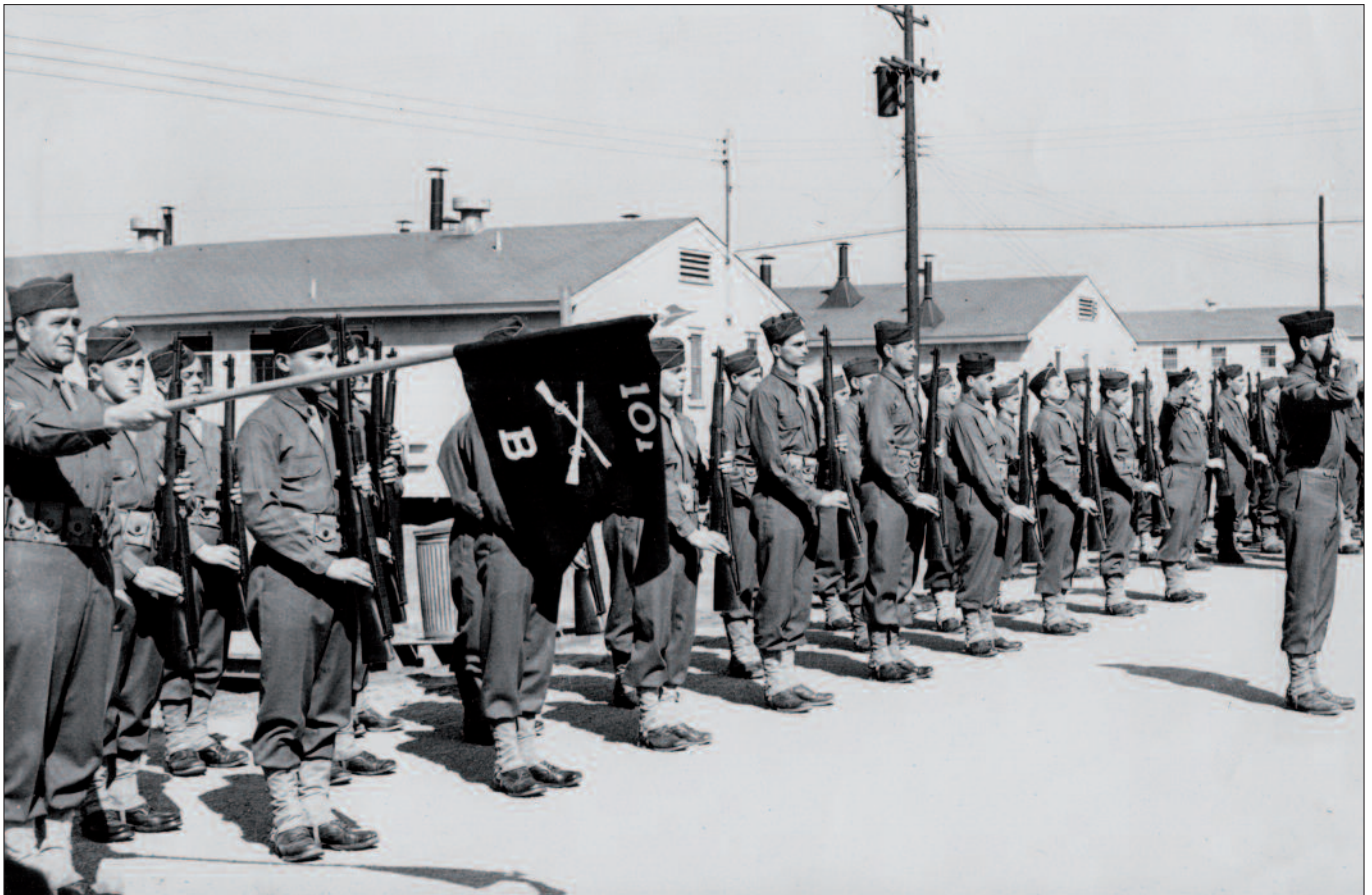
Angehörige der Kompanie B des „Austrian Battalion“ auf dem Exerzierplatz in Camp Atterbury.