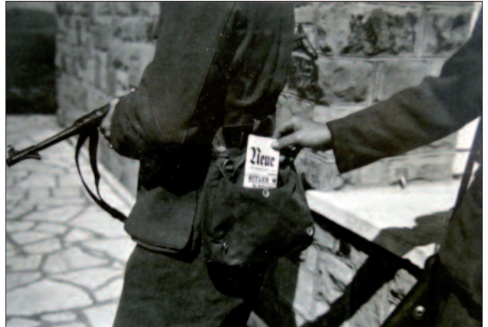
OSS-Operation Sauerkraut: österreichische Emigranten als „Propagandabriefträger“.

ordnen musste. Anhand von biographischen Fallstudien zeigte Dr. Traussnig die Verwendungen der Exilösterreicher in den westalliierten Streitkräften auf, sei es die Nutzung von Intellektuellen und Geistlichen, aber auch die Expertise des Alpinismus im Aufbau der „10th Mountain Division“ der US-Army. Als „pragmatische Zweckkoalition wider den Zivilisationsbruch Nationalsozialismus“ wurde somit die Tätigkeit der Exilösterreicher eingestuft, da dies eine der wenigen Möglichkeiten war, die nicht zum Scheitern verurteilt war.