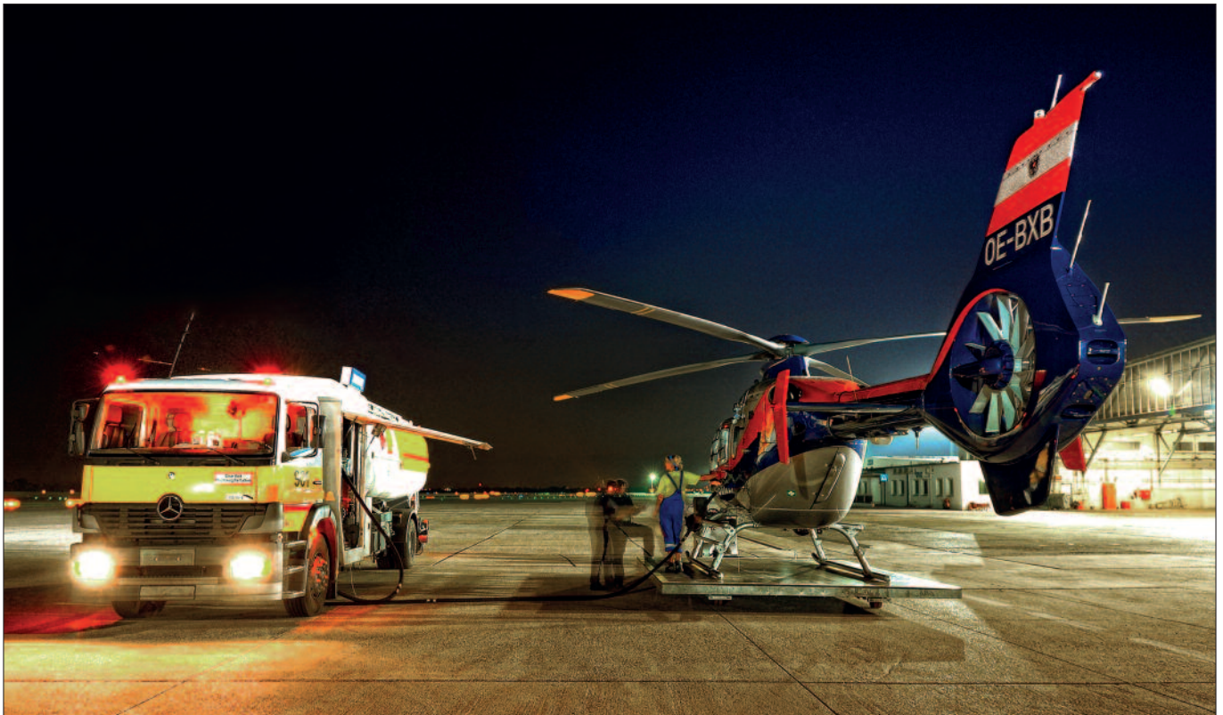
Hubschrauber der Flugpolizei beim Auftanken auf dem Flughafen Wien-Schwechat.

Wissen und Können, mit der Fähigkeit, dieses fruchttragend weiterzuvermitteln. Zusätzlich muss man in der Lage sein, einen Fehler des Schülers blitzschnell zu korrigieren – denn als Fluglehrer übernimmt man die Letztverantwortung über den Flug“, ergänzt Raffler.