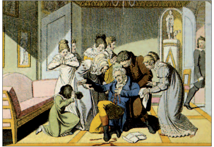
Ermordung des Schriftstellers August von Kotzebue 1819 (zeitgenössische Darstellungen): „Verräter des Vaterlandes!“