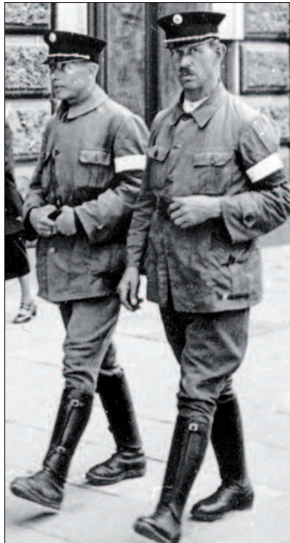
Gemeindegewachleute auf Streife.

Verbot der Gemeindegewache. Nach der „Selbstausschaltung“ des Parlaments am 4. März 1933 12 erließ die Regierung unter Bundeskanzler Engelbert Dollfuß eine Verordnung aufgrund des „Kriegswirtschaftlichen Ermächtigungsgesetzes“, mit der die Vorzensur über Zeitungen verhängt werden konnte. Öffentliche Umzüge und Versammlung wurden verboten und es wurden weitere Notverordnungen erlassen. Mitte März wurde in Tirol die Heimwehr als „Notpolizei“ anerkannt und der Republikanische Schutzbund aufgelöst. Am 31. März 1933 wurde die Tätigkeit des Schutzbundes verboten. Daraufhin wurden etwa 100 Schutzbund-Angehörige in die Gemeindegewache aufgenommen – als „Saisonarbeiter“ für 20 Wochen, um danach Anspruch auf Arbeitslosenentgelt zu haben.