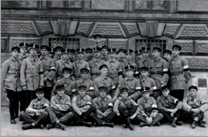
Angehörige der Gemeindefache vor dem Rathaus: Die Wache wurde nach dem Putschversuch im Februar 1934 aufgelöst.