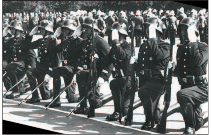
Angelobung der neuen, regierungstreuen Gemeindefache im September 1934 im Wiener Rathaus.

April 1935 wurde er im sogenannten „Schutzbundprozess“ gegen 21 führende Angehörige des Republikanischen Schutzbundes zu zehn Jahren schweren Kerkers verurteilt. Am 14. Dezember 1935 wurde er aus der U-Haft entlassen. Seine Verurteilung war nicht rechtskräftig geworden, da der Oberste Gerichtshof im Oktober 1934 seiner Nichtigkeitsbeschwerde stattgegeben und den Fall zur neuerlichen Verhandlung an das Erstgericht verwiesen hatte. Theodor Schubauer emigrierte 1938 mit seiner jüdischen Frau nach England, wo er für das im Winter 1939/40 in London gegründete Austrian Office rekrutiert wurde, das dem britischen Kriegsgeheimdienst Special Operations Executive (SOE) unterstand. Schubauer sollte mit Franz Preiss im Februar 1941 nach Jugoslawien reisen, um SOE-Kontakte zu sozialistischen Zellen in Wien auszubauen. Die Mission scheiterte. Das Schiff, mit dem Schubauer und Preiss Richtung jugoslawische Küste fuhren, wurde am 24. Februar 1941 vor der westafrikanischen Küste von einem U-Boot torpediert. Beide Österreicher ertranken.