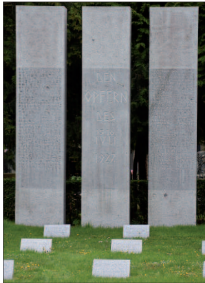
Gedenkstätte für die Opfer des 15. Juli 1927 auf dem Wiener Zentralfriedhof.

Schwierig war die Ordnungstätigkeit etwa im städtischen Wohnungsamt oder im Fürsorgeamt, wo immer wieder verzweifelte Menschen ausrasteten. „Dass diese armen, verzweifelten Menschen nicht gerade leicht zu behandeln sind, ist klar. Und doch wickelt sich der Dienst unter der Aufsicht der Gemeindegewache ruhig und klaglos ab. Randalisiert einer, so wird er eben nicht gleich arretiert, sondern in neun von zehn Fällen genügen ein paar begütigende Worte, um auch den Aufgeregtesten wieder zur Vernunft zu bringen“, heißt es in einem Zeitschriftenartikel über die Gemeindegewache im August 1929. 7 Mit der Leitung der Gemeindegewache wurde zunächst der Wiener Branddirektor betraut. Der Personalthöchstand wurde vom Gemeinderat mit 1.000 bestimmt.