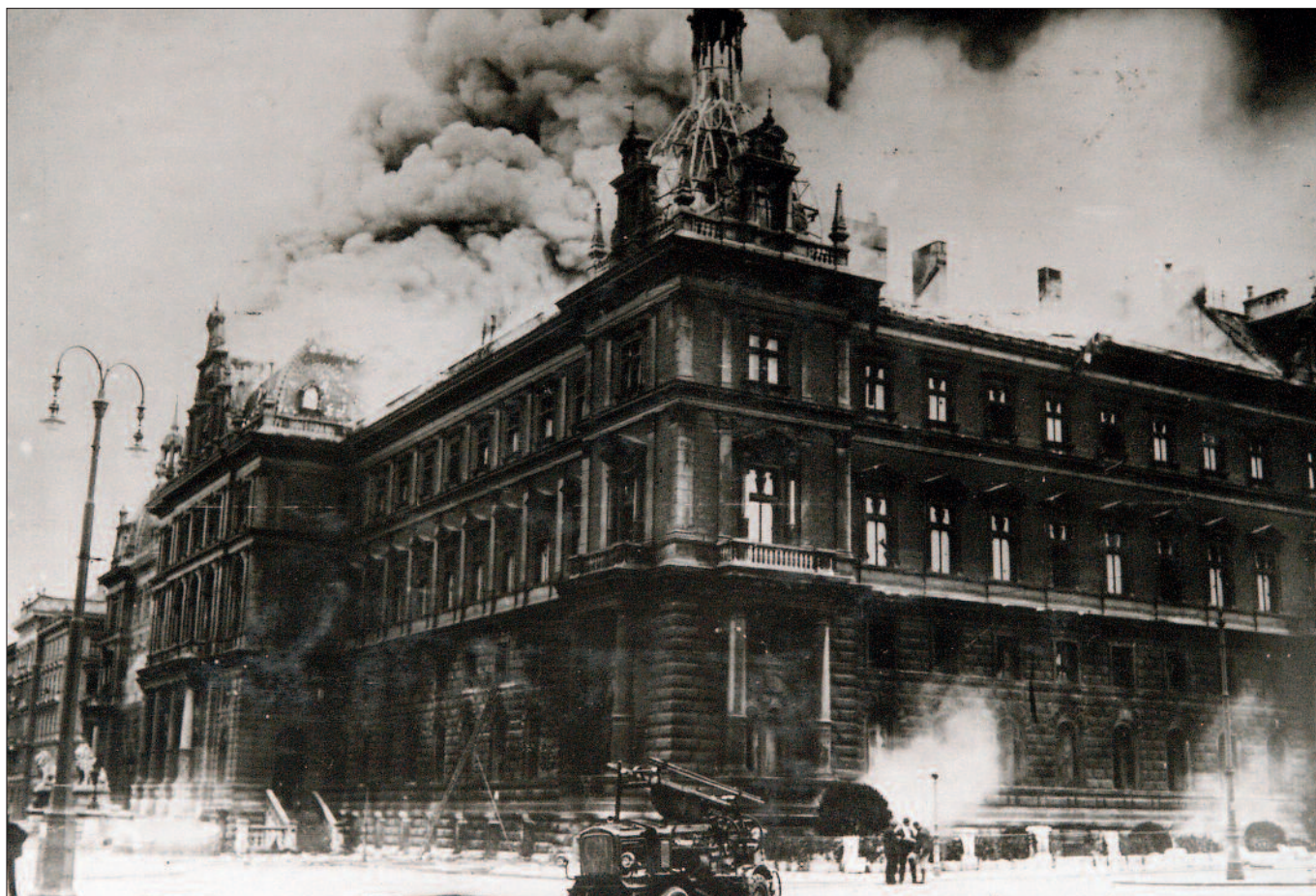
Sturm auf den Justizpalast am 15. Juli 1927: Die Ausschreitungen führten zur Gründung der Wiener Gemeindefschutzwache.